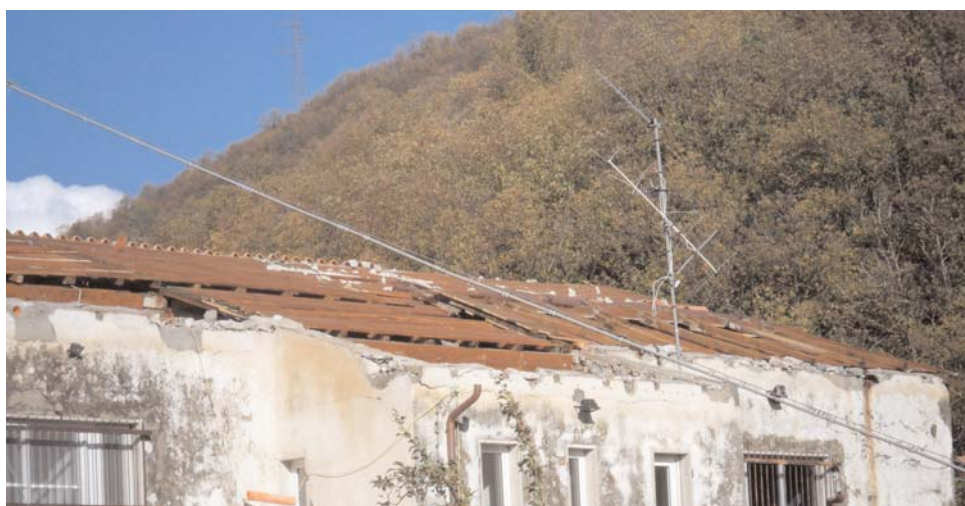
Nella foto la sede del Circolo AICS U.S. Cecina (frazione di Fivizzano nella provincia di Massa Carrara). Il tetto è stato demolito dalle piogge torrenziali.