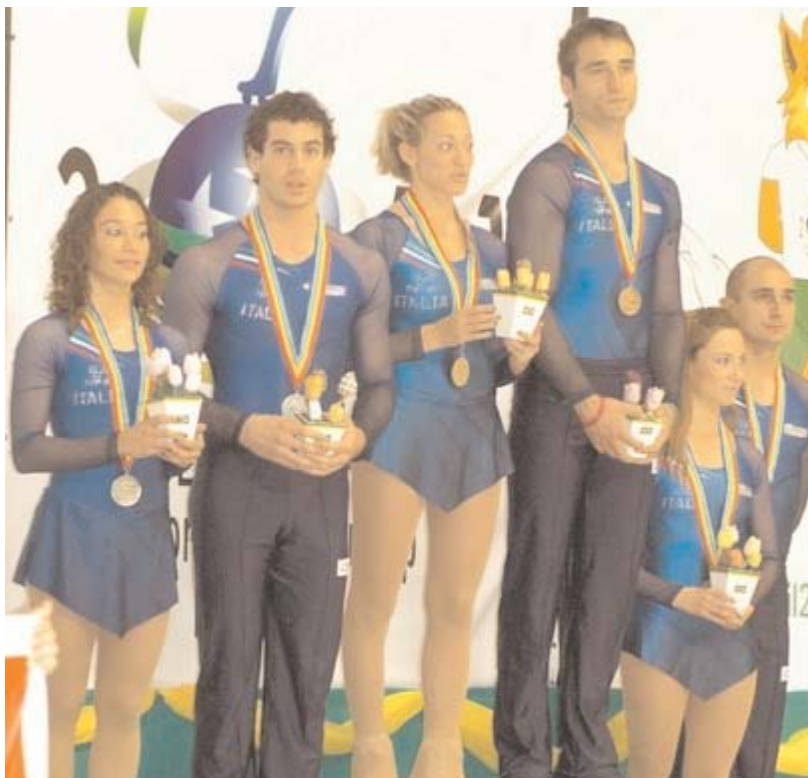
Il podio delle coppie artistico senior