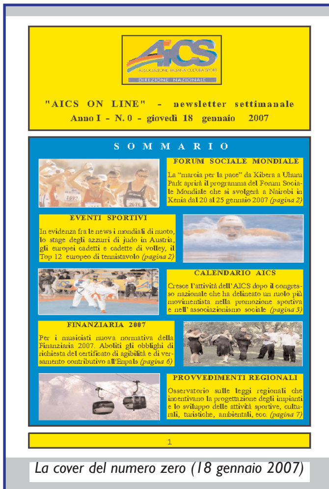
La cover del numero zero (18 gennaio 2007)