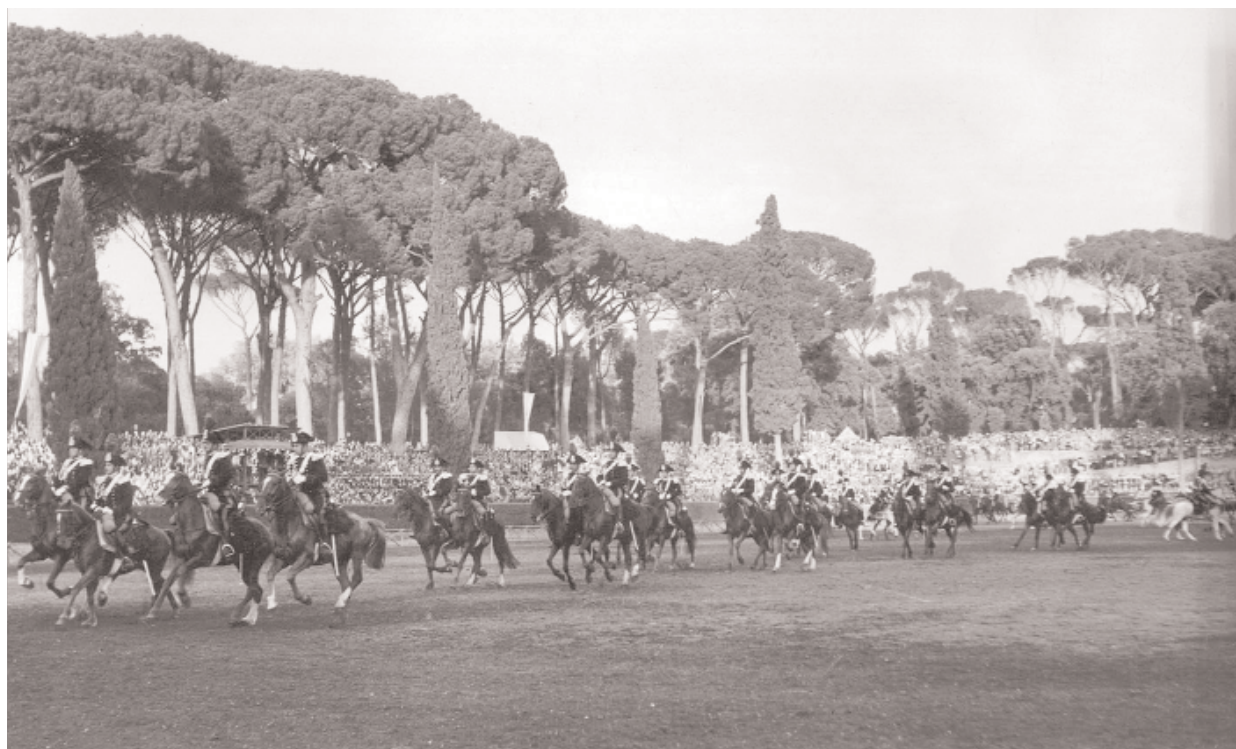
Roma. La spettacolare e storica performance equestre dei carabinieri a "Piazza di Siena".