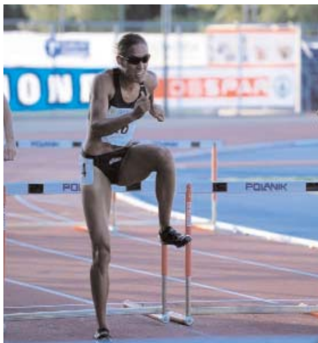
La pluricampionessa mondiale Lolo Jones