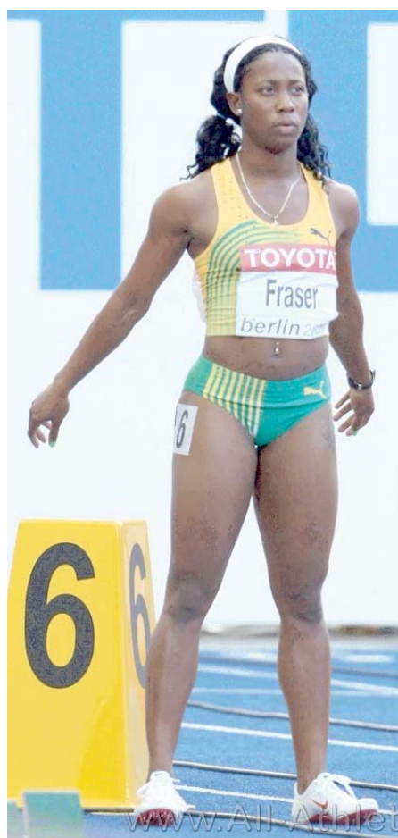
La testimonial giamaicana Shelly Ann Fraser campionessa olimpica