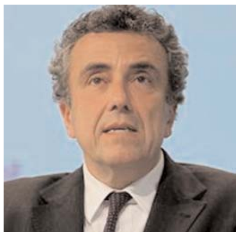
Il Ministro Fabrizio Barca

La cura dei beni comuni, attraverso la disponibilità e l'impegno dei cittadini organizzati in migliaia di associazioni, la forza innovativa di giovani, donne, famiglie che oggi continuano a scommettere sul futuro, la ripresa della partecipazione dei cittadini, in definitiva la coesione sociale, sono tutti obiettivi percorribili ma che non sono stati presi in considerazione. Il Terzo Settore ha la capacità di costruire questo nuovo modello di sviluppo, ma ha bisogno che la sua autonomia, l'impegno e le risorse che offre vengano riconosciute e rispettate.