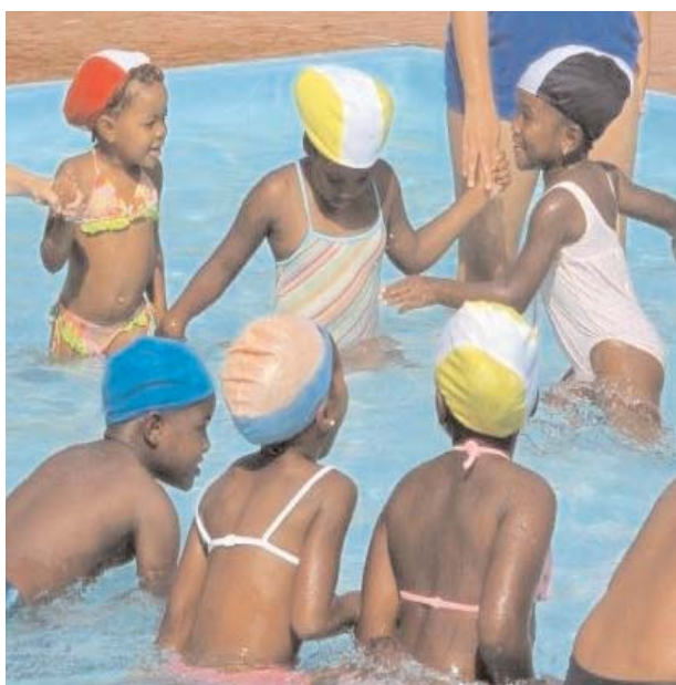
I bambini della tendopoli a Finale Emilia

D. Da sempre Telefono Azzurro sottolinea la priorità di una cultura della prevenzione affinché la tutela dei bambini e degli adolescenti venga coniugata quotidianamente nell'entourage delle più importanti centrali educative (famiglia e scuola). A quale stadio evolutivo sono giunte in Italia le politiche della prevenzione? E' ancora lontano il traguardo di una qualità della vita che possa garantire livelli di eccellenza per il benessere psico-fisico dei giovanissimi?